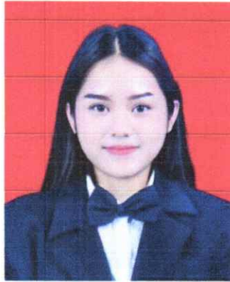
Gambar 1. Foto dengan background warna merah

email : Info@stikom-bali.ac.id | website : www.stikom-bali.ac.id